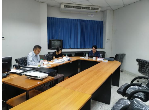
คณะกรรมการประเมินฯ ประชุมวางแผนการประเมินฯ และดำเนินการศึกษารายงานการประเมินตนเองของสาขาวิชา และเอกสารที่เกี่ยวข้อง