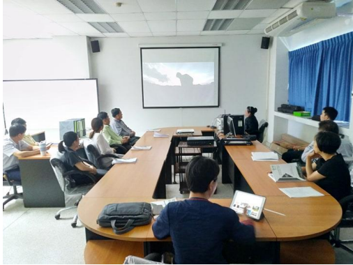
ประธานอาจารย์ประจำหลักสูตร กล่าวต้อนรับ คณะกรรมการประเมินฯ ประธานกรรมการประเมินฯ กล่าวชี้แจงวัตถุประสงค์ของการประเมิน