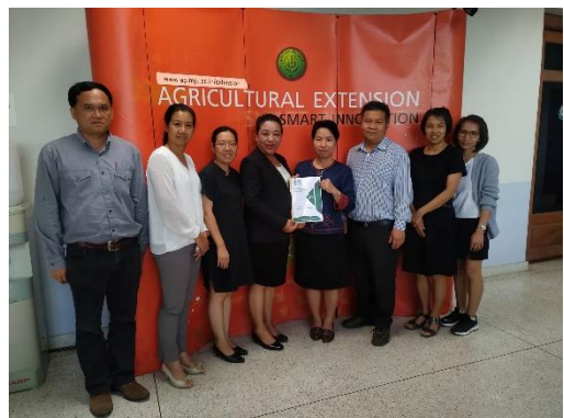
คณะกรรมการประเมินฯ ส่งมอบรายงานผลการประเมินคุณภาพการศึกษาภายใน