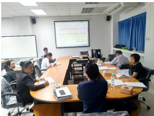
คณะกรรมการประเมินฯ สรุปผลการประเมิน และข้อเสนอแนะรับฟังผลการประเมินและข้อเสนอแนะจากคณะกรรมการประเมินฯ