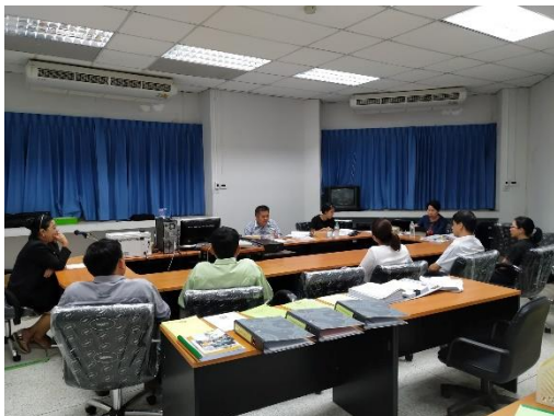
คณะกรรมการประเมินฯ สัมภาษณ์อาจารย์