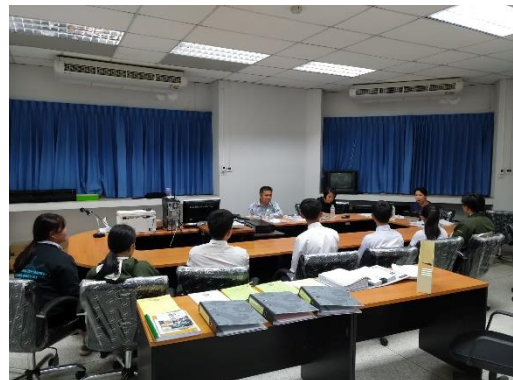
คณะกรรมการประเมินฯ สัมภาษณ์นักศึกษา