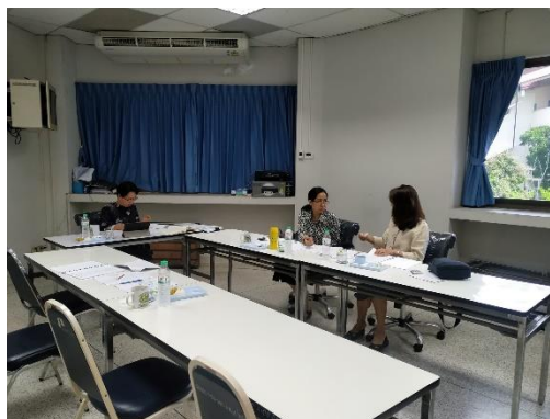
คณะกรรมการประเมินฯ ประชุมวางแผนการประเมินฯ และดำเนินการศึกษารายงานการประเมินตนเองของสาขาวิชา และเอกสารที่เกี่ยวข้อง