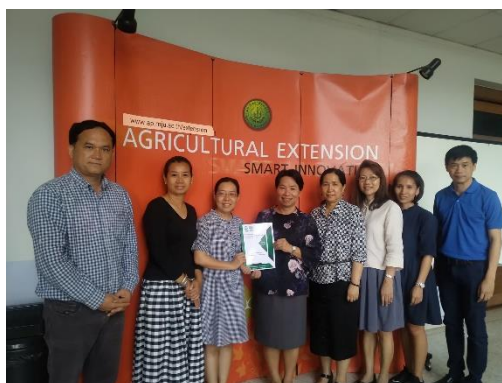
คณะกรรมการประเมินฯ ส่งมอบรายงานผลการประเมินคุณภาพการศึกษาภายใน