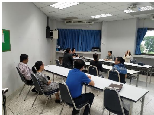
ประธานอาจารย์ประจำหลักสูตร กล่าวต้อนรับ คณะกรรมการประเมินฯ ประธานกรรมการประเมินฯ กล่าวชี้แจงวัตถุประสงค์ของการประเมิน