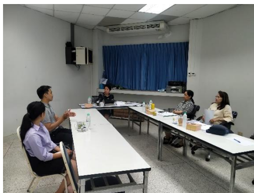
คณะกรรมการประเมินฯ สัมภาษณ์นักศึกษา