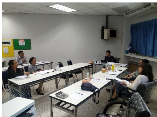
คณะกรรมการประเมินฯ สัมภาษณ์อาจารย์