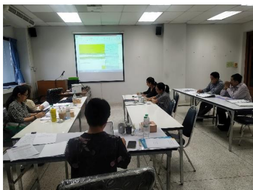
คณะกรรมการประเมินฯ สรุปผลการประเมิน และข้อเสนอแนะรับฟังผลการประเมินและข้อเสนอแนะจากคณะกรรมการประเมินฯ